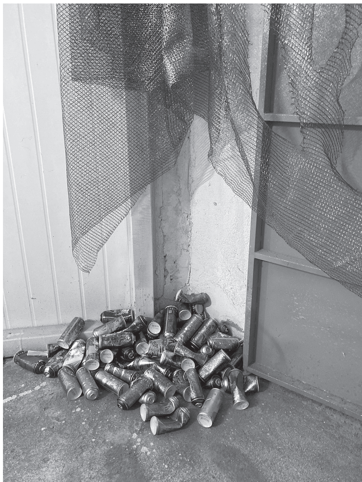
Илл. 3. Банки. Часть экспозиции выставки «Блеск и нищета» в Санкт-Петербурге. 25 сентября 2021 года.